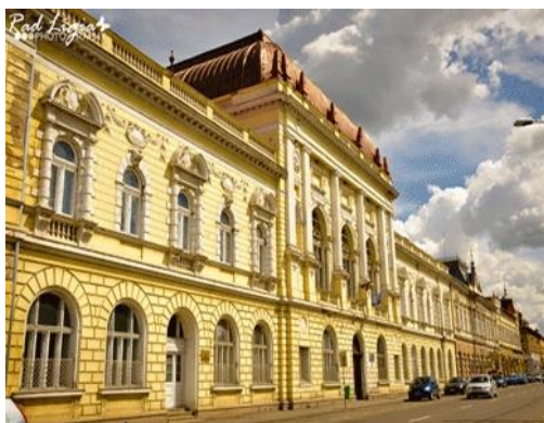
Facultatea de Medicină și Farmacie Oradea – sediul central