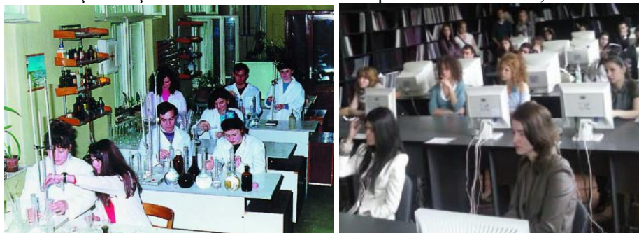
Laboratoare de specialitate

În tabelul 1.2 se prezintă situația sintetică a spațiilor destinate proceselor de învățământ.