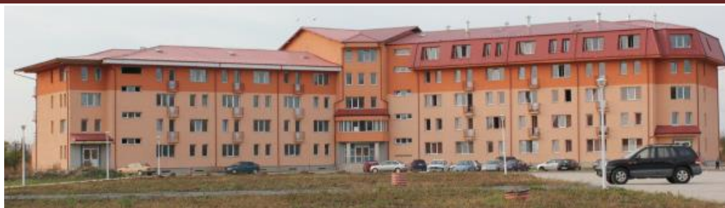
Cămin studențesc, Campus I