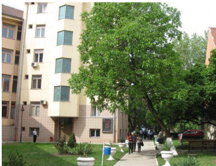
Universitatea din Oradea-Campus Central

Universitatea din Oradea (UO) se definește ca o instituție de învățământ superior situată la granița de vest a României având un rol decisiv în dezvoltarea socio-economică și culturală a zonei geografice unde își desfășoară activitatea. Pornind de la acest rol UO și-a asumat un spectru larg de domenii de învățământ care să acopere cerințele unei dezvoltări durabile a acestor domenii atât la nivel național cât și internațional prin recunoașterea activității depuse după absolvire de către absolvenții acestei universități cât și prin rezultatele științifice ale personalului didactic.